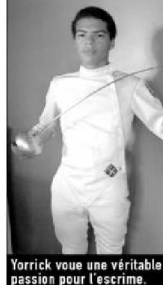
Yorrick voue une véritable passion pour l'escrime.