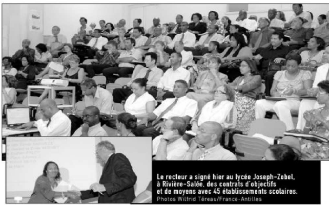
Le recteur a signé hier au lycée Joseph-Zobel, à Rivière-Salée, des contrats d'objectifs et de moyens avec 45 établissements scolaires.