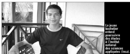
Le jeune bachelier entend poursuivre des études à l'Institut national des sciences appliquées (Insa).