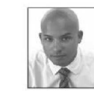
par les pouvoirs publics.

Une estimation approximative de son patrimoine immobilier peut avoir de fâcheuses conséquences. Les biens de rapport, les locaux industriels et commerciaux doivent être régulièrement évalués sans pour autant être mis en vente. La situation devient plus complexe lorsque ces immeubles ont été rénovés partiellement ou totalement, ou encore lorsqu'ils ont changé de destination. Que vaut par exemple une villa transformée en maison de retraite ou un ancien petit hôtel transformé en centre de séminaire ? Enfin, que penser des biens immobiliers composés (différents types de constructions ou/et d'usages), des biens grevés par des restrictions de constructions et des servitudes, des biens implantés dans des environnements pollués ou contenant des matériaux dont l'usage a été réglementé