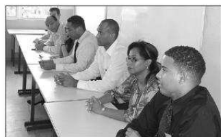
De nombreux professionnels sont venus pour répondre aux différentes questions des étudiants.