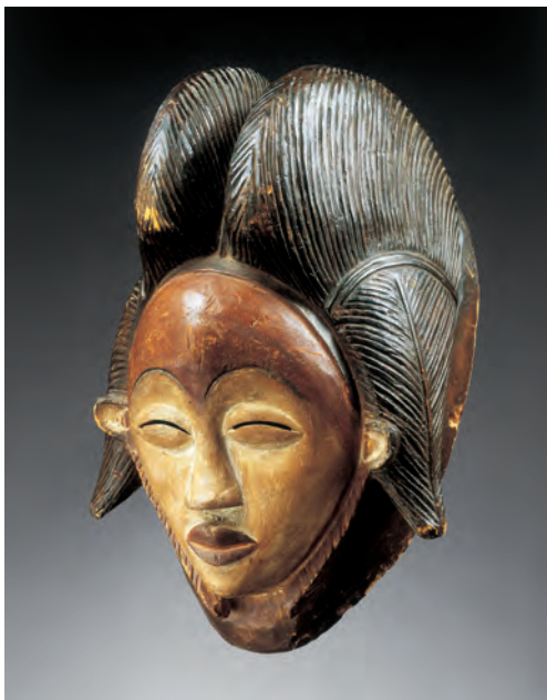
Punu, Gabon, masque mukuyi