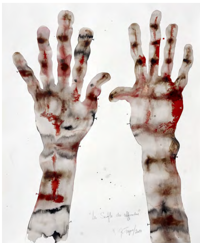
Barthélemy Toguo, Le Souffle des offrandes , 2010 Aquarelle sur papier marouflé sur toile, 107 x 89 cm