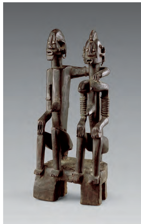
Dogon, Mali, statue dege dyinge représentant le « couple de jumeaux primordiaux » Bois, métal et pigments, H. : 66 cm