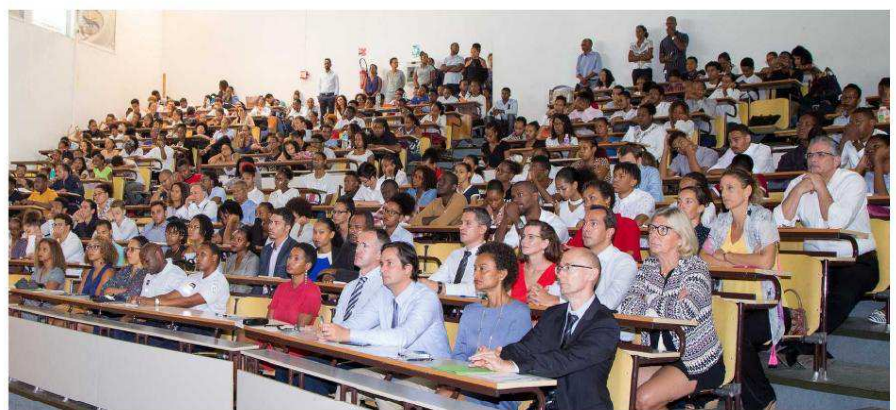
De nombreux étudiants sont venus à la rencontre des partenaires de ce forum.